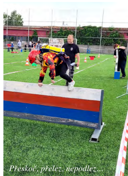
Přeskoč, přelez, nepodlez...