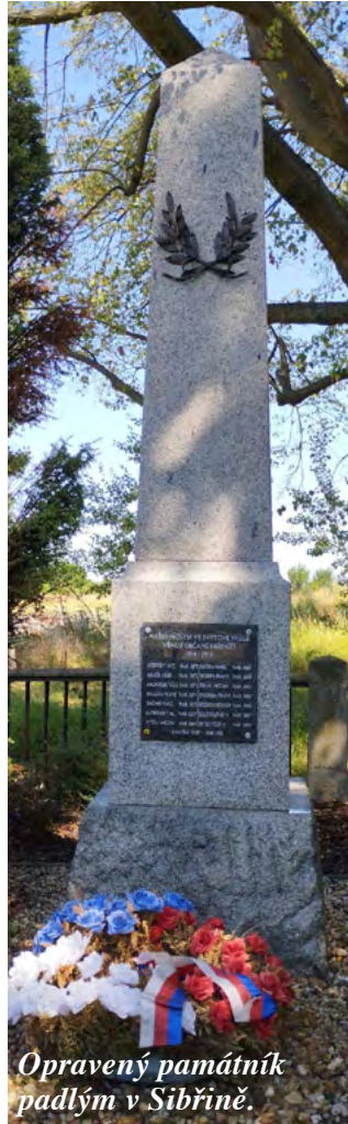
Opravený památník padlým v Sibřině.