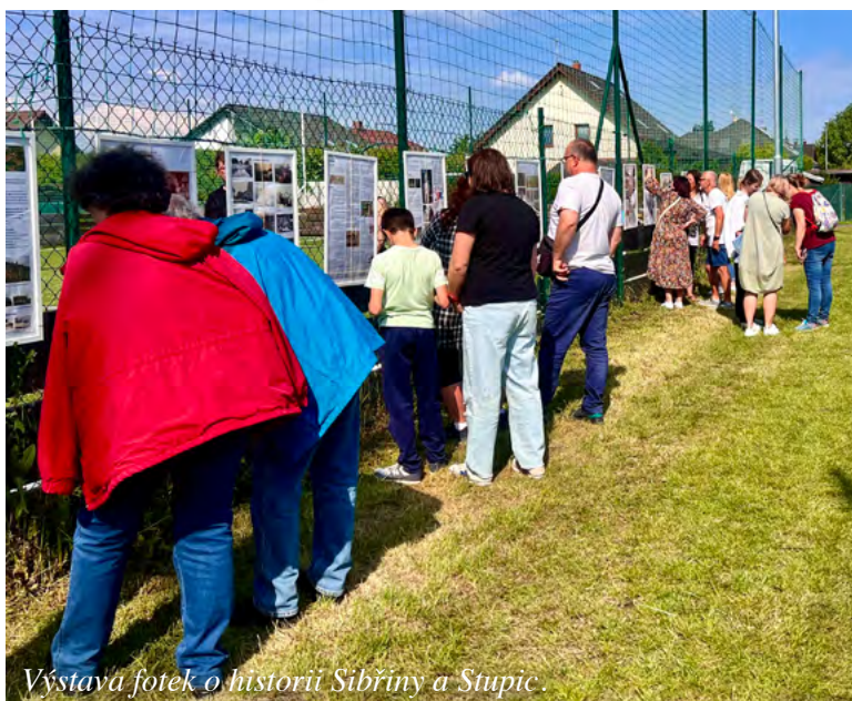
Výstava fotek o historii Sběřiny a Stupic.