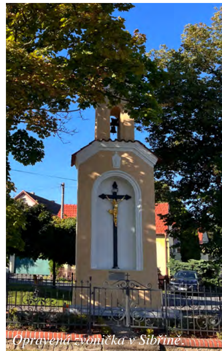
Opravená zvonička v Sibříně.