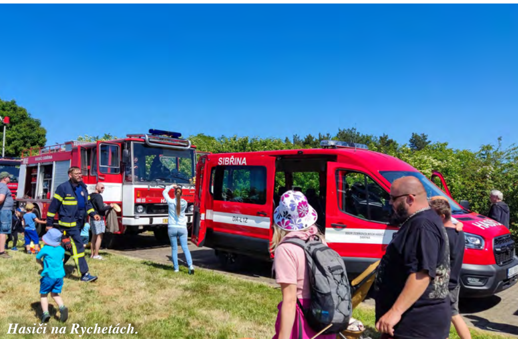
Hasiči na Rychetách.