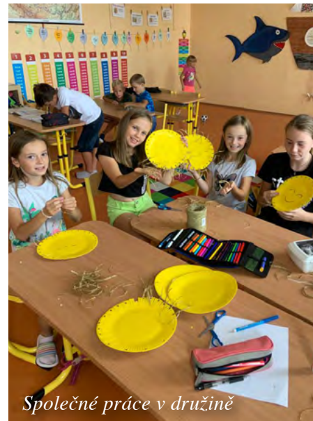
Společné práce v družině