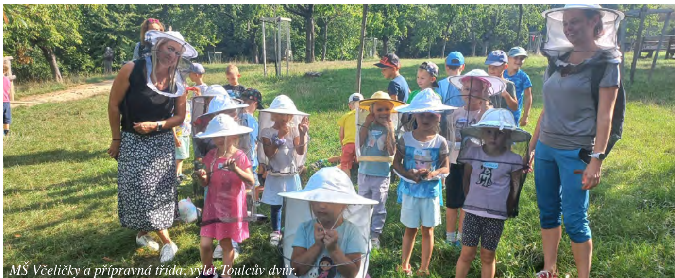
MŠ Včeličky a přípravná třída, výlet Toulcův dvůr.