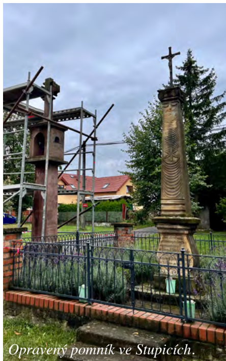
Opravený pomník ve Stupicích.