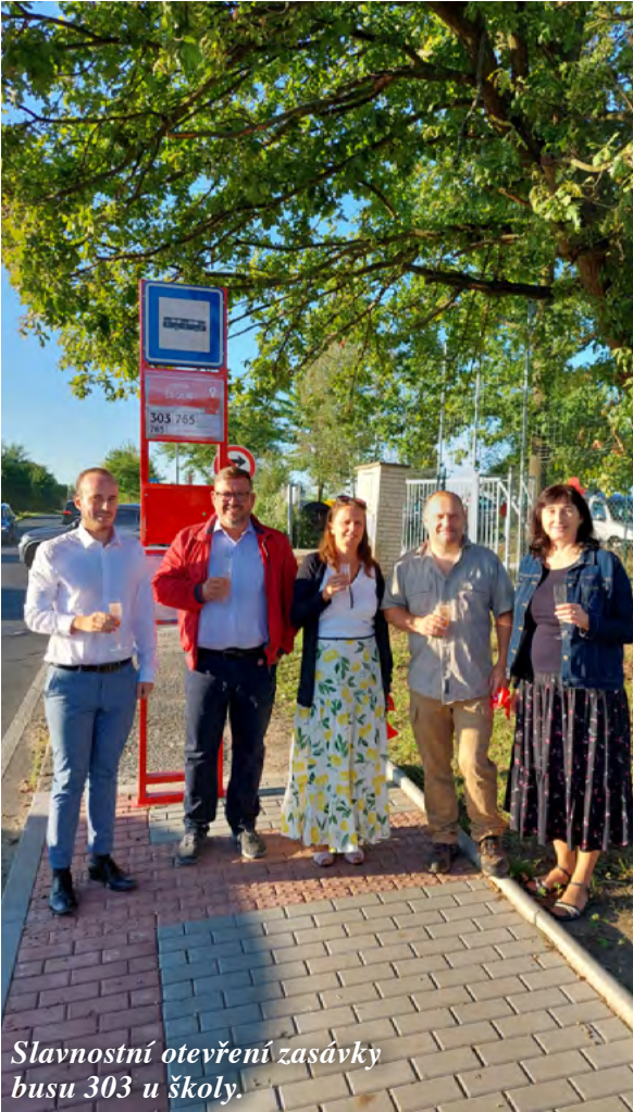
Slavnostní otevření zastávky busu 303 u školy.