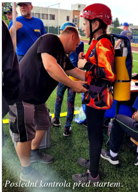
Poslední kontrola před startem.

Mladí hasiči se dne 17. 6. zúčastnili závodu Satalický železný hasič junior 2023 v Praze – Satalicích, který je součástí Pražské a Středočeské ligy TFA. Byl to poslední závod před prázdninami. Účast byla hojná - od benjamínků, kteří nasávali atmosféru svého prvního závodu až po zkušené závodníky, díky kterým i tentokrát cinkla nějaká ta medaile. Po prázdninové pauze se děti sešly ve středu prvního zářijového týdne, aby si osvěžily dovednosti a nadále trénovaly na nadcházející soutěže. Dne 9. 9. se pak dva členové kroužku Mladí Hasiči