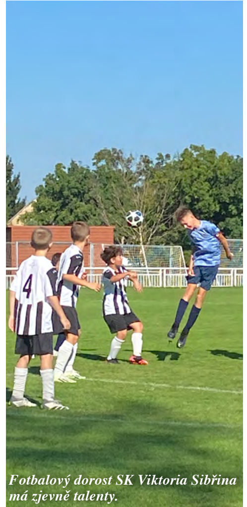
Fotbalový dorost SK Viktoria Sibřina má zjevně talenty.