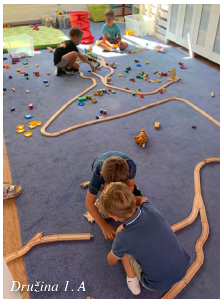
Družina 1. A