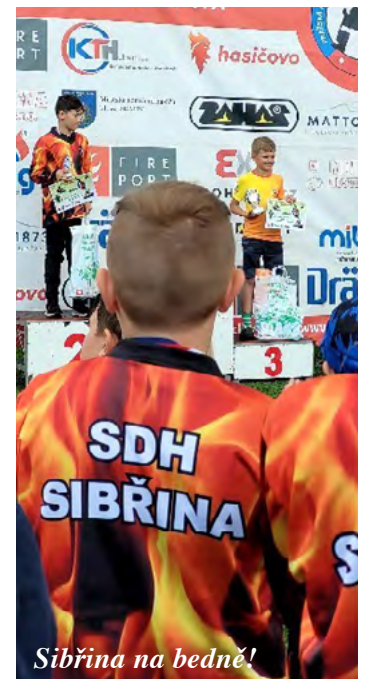
Sibřina na bedně!