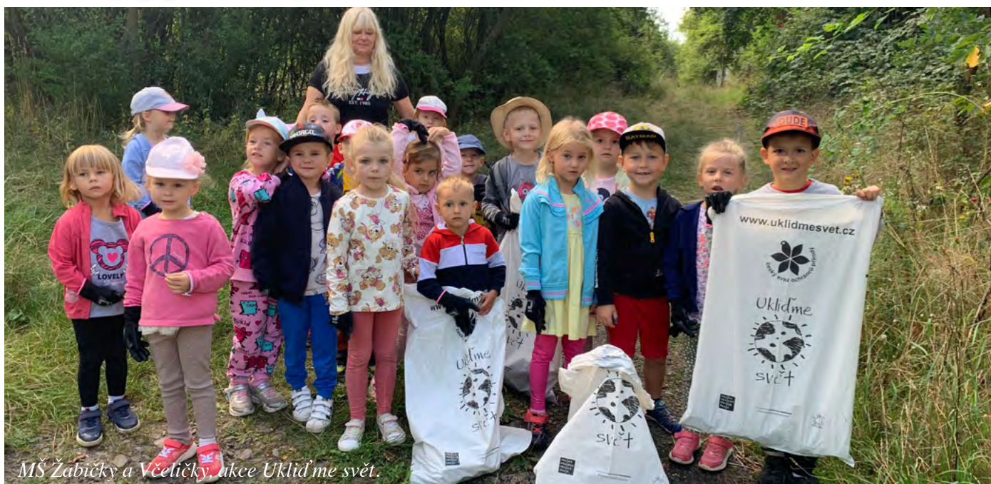
MŠ Žabičky a Včeličky, akce Uklidme svět.