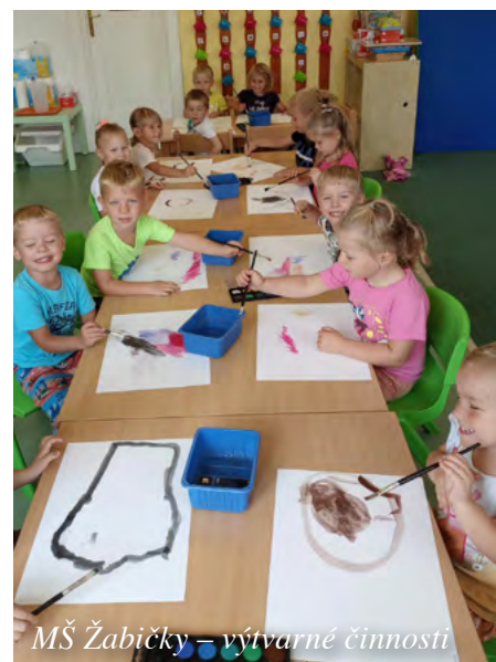
MŠ Žabičky – výtvarné činnosti