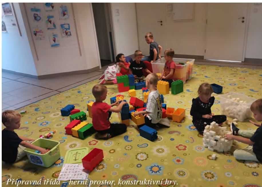
Přípravná třída – herní prostor, konstruktivní hry.

Nový školní rok začal v pondělí 4. 9. Uvítali jsme nové a nejmenší dětičky ze třídy Žabiček a starší ze třídy Včelíček. Pro každé dítě jsou začátky v mateřské škole spojeny s více