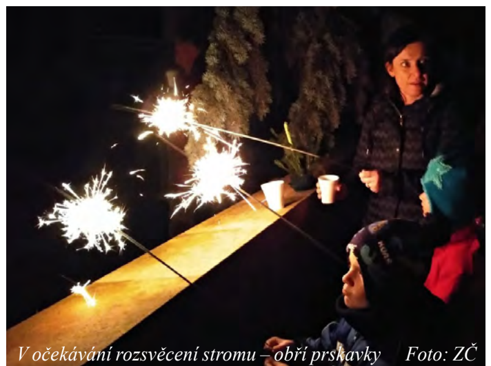
V očekávání rozsvěcení stromu – obří prskavky