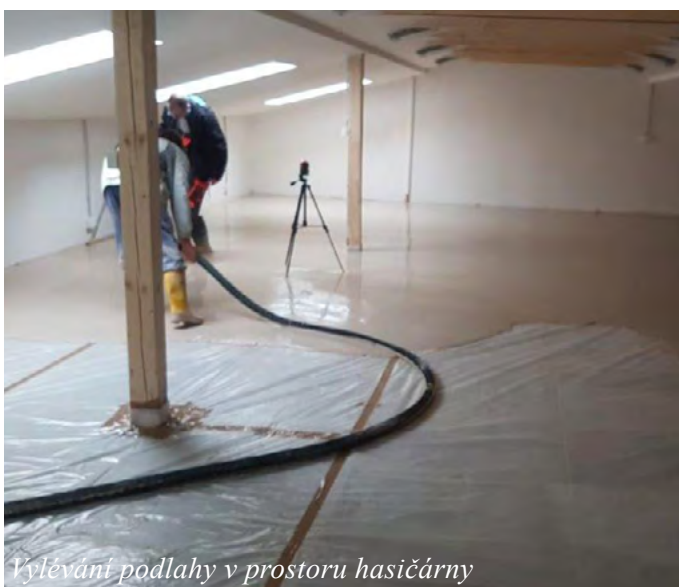
Vylévání podlahy v prostoru hasičárny