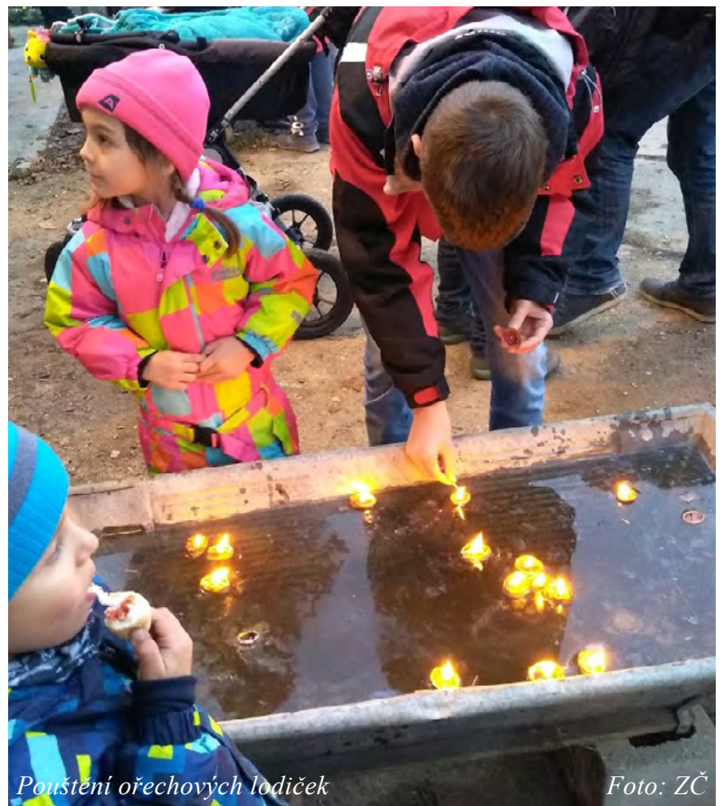
Pouštění ořechových lodiček