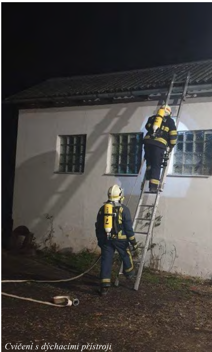
Cvičení s dýchacími přístroji