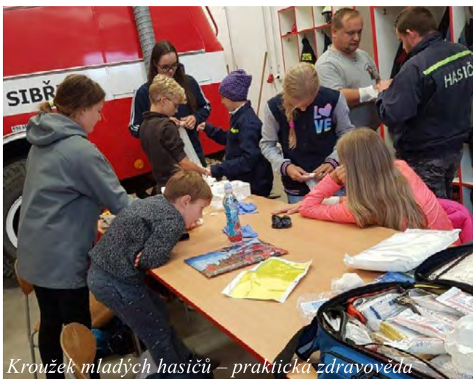
Kroužek mladých hasičů – praktická zdravotěda