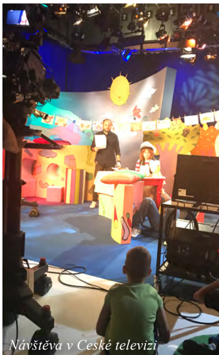
Návštěva v České televizi