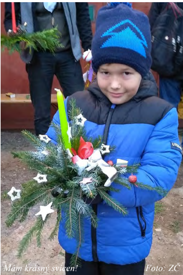
Mám krásný svícen!

Děti si pouštěly na dvoře svíčky z ořechových skořápek, starší kluci pomáhali těm menším zapálit svíčky a pouštět je po hladině rybníka (velké vany). – pokračování v rubrice Zprávy z obce –