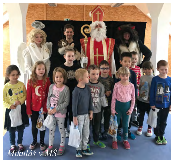
Mikuláš v MŠ