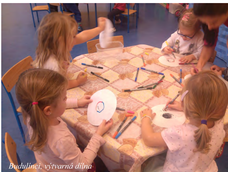
Budulinci, výtvarná dílna