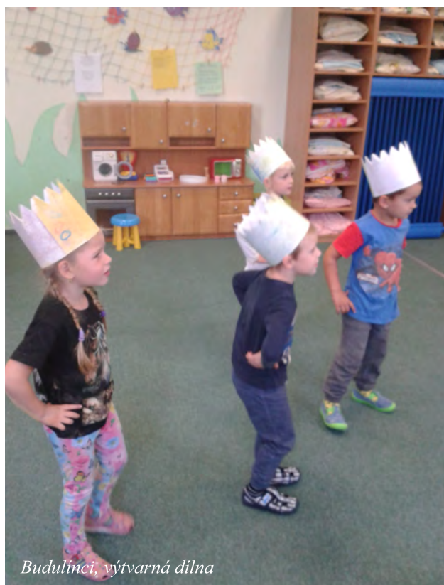
Budulinci, výtvarná dílna