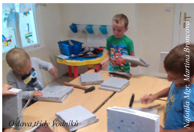
Oslava třídy Vodníků