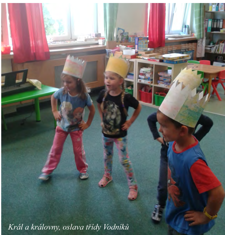
Král a královny, oslava třídy Vodníků